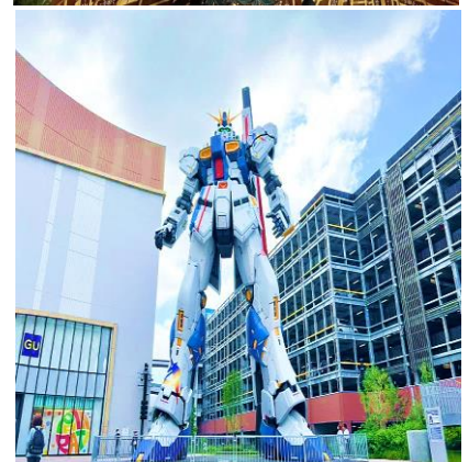
หุ่นกันดั้ม รุ่นใหม่ชื่อ RX93 FF Nu Gundam

📍 รับประทานอาหารกลางวัน ณ ภัตตาคาร เดินทางไปยัง ร้านค้า DUTY FREE ให้ท่านได้ซื้อของ อาทิ เครื่องสำอาง เซรั่ม โฟมล้างหน้า ยา คอลลาเจน และอาหาร ฯลฯ ... จากนั้นต่อไปยัง ฟูกูโอกะ แวะแชะรูปกับหุ่นกันดั้มยักษ์ตัวใหม่ล่าสุด (เม.ย. 22) ณ ห้าง LaLaport มีขนาดใหญ่กว่า Unicorn Gundam ที่โตเกียวและใหญ่กว่า RX93 FF Gundam ที่ Gundam Factory Yokohama เรียกได้ว่าเป็นแลนด์มาร์คสำคัญของเมืองฟูกูโอกะในปัจจุบัน (หากมีเวลาพอ) ... จากนั้นอิสระให้ท่านช้อปปิ้ง ย่านเทนจิน (Tenjin) หรือ ย่านฮากาตะ (Hakata) เป็นย่านช้อปปิ้งขนาดใหญ่ใจกลางเมือง รวบรวมแหล่งบันเทิง