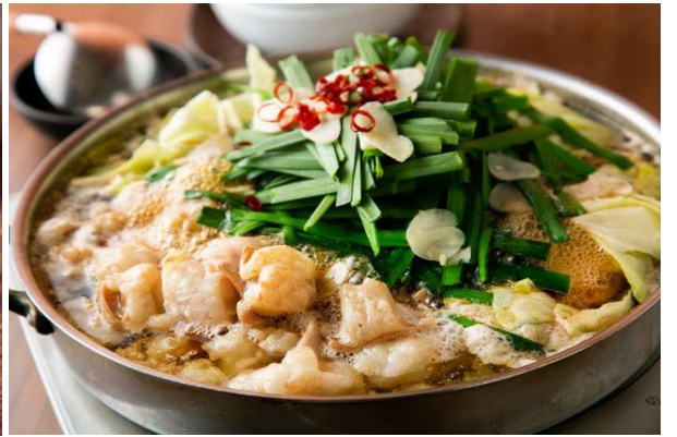
มตสึนาเบะ (Motsunabe)