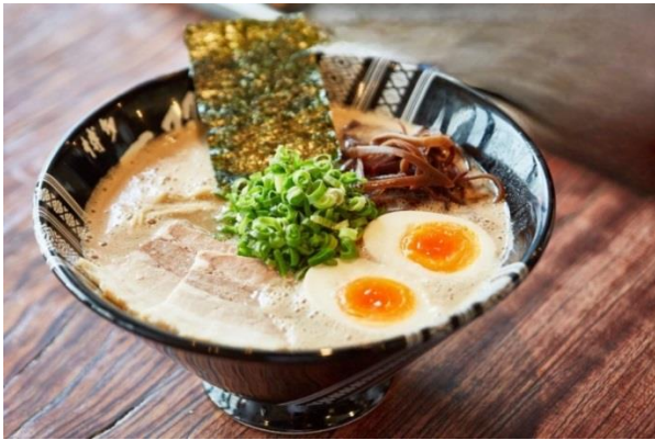
ฮากาตะราเมง (Hakata Ramen)