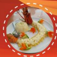
สลัดกุ้งมังกร