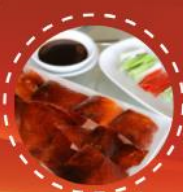
เปิดปีกัง