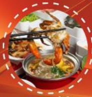
ชาบู ปูฟเฟ็ต