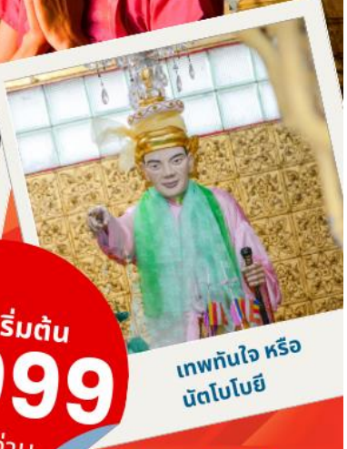
เทพทันใจ หรือ นัตโบทโยยี