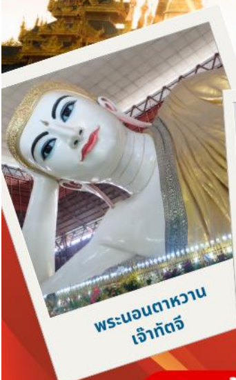
พระนอนตาหวาน เจ้ากัตตี