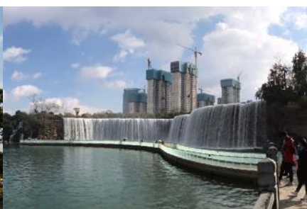
สวนน้ำตก Kunming Waterfall Park