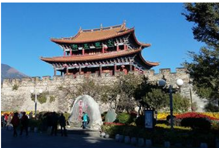
เมืองโบราณต้าลี่