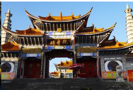
วัดเจ้าแม่กวนอิมเปลงกาย