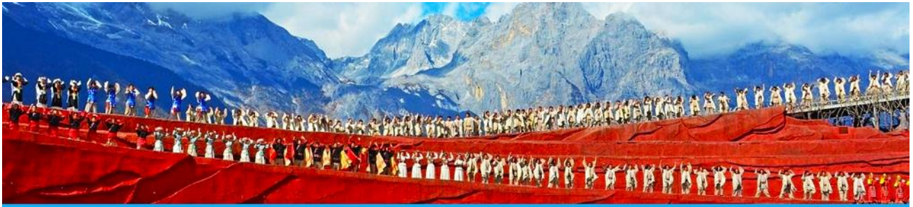
การแสดง IMPRESSION LIJIANG

ชมการแสดง IMPRESSION LIJIANG โชว์อันยิ่งใหญ่โดยผู้กำกับชื่อดังของโลก “จาง อี้โหมว” ได้เนรมิต ให้ภูเขาหิมะมังกรหยกเป็นฉากหลัง และบริเวณทุ่งหญ้าเป็นเวทีการแสดง โดยใช้นักแสดงกว่า 600 ชีวิต แสดง สีเสีงการแต่งกายตระการตาเล่าเรื่องราวชีวิตความเป็นอยู่และชาวเผ่าต่างๆของเมืองลี่เจียง