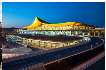
สนามบิเบียงเมืองคุนหมิง