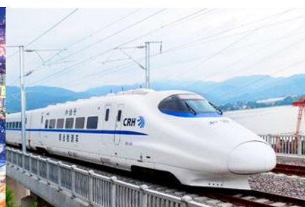
บ้รกาไฟควมเร็วสูง