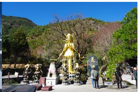
อุทยานน้ำหยก