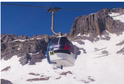
ภูเขาหิมะมังกรหยก (นั่งกระเช้าใหญ่)

ที่พัก FENG HUANG HOTEL ระดับ 4 ดาว หรือเทียบเท่าเมืองลี่เจียง