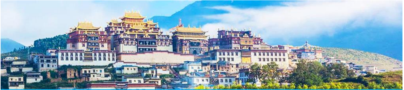
เมืองโบราณเซงกรีล่า

จากนั้นนำท่านชม หมู่บ้านซีโจวหรือหมู่บ้านชาวไป๋ ชนพื้นเมืองที่สำคัญของเมือง ชมการแสดงของชน ชาติป้ายพร้อมชิมชาสามแก้ว เพื่อรำลึกถึงวิถีชีวิตและการเกิดมาเป็นมนุษย์ของตนเอง ซึ่งถือเป็นเอกลักษณ์ ของชนชาวไป๋ที่หาดูได้ยาก