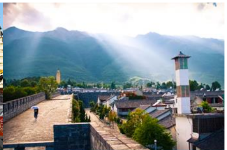
หมู่บ้านซีโจว(หมู่บ้านชาวป๋อ)