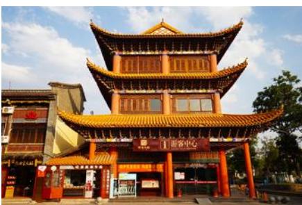
เมืองโบราณกวนตุ๋

พักที่ FEI LONG HOTEL ระดับ 4 ดาว หรือเทียบเท่าในเมืองต้าหลี่